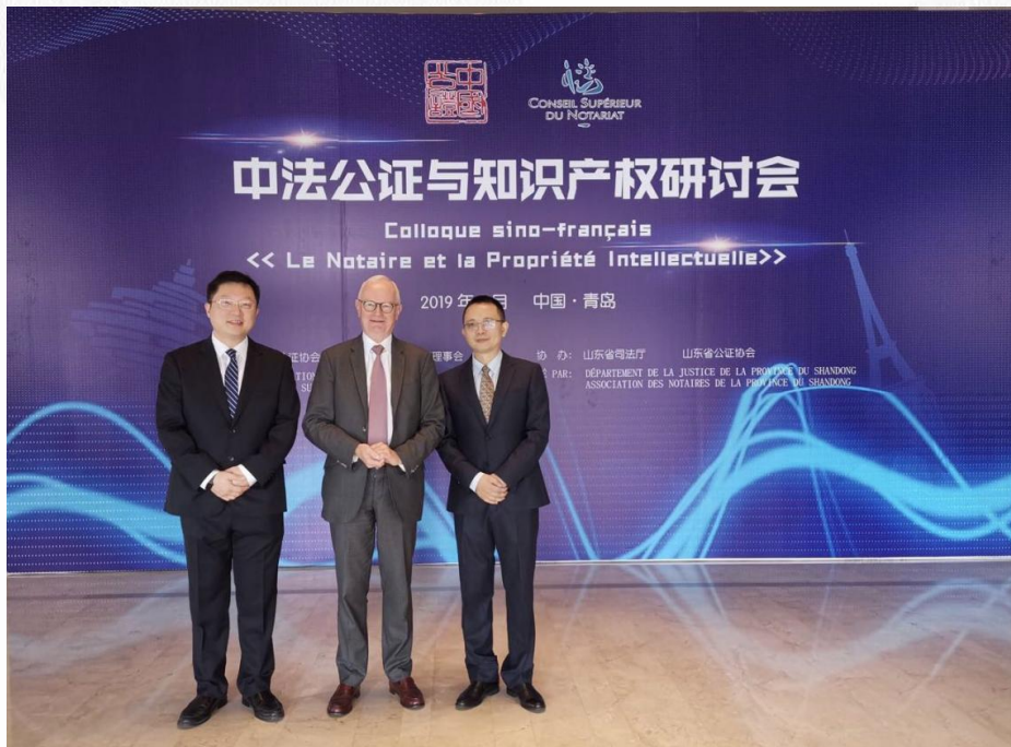
张铮、蔡勇二人作为演讲人与法国公证人高等理事会主席安贝尔先生合影